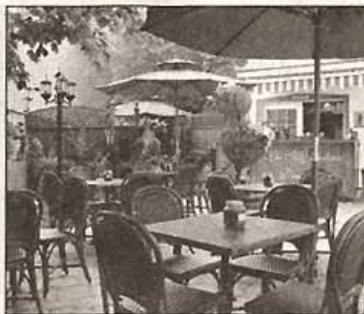
La terrasse de la Fudgerie-boutique Les Mignardises Doucinet

→ La Fudgerie-boutique Les Mignardises Doucinet ouvre cette semaine sa Terrasse Dessert. Conçue comme un lieu de détente dans une ambiance feutrée en plein cœur du quartier histori-