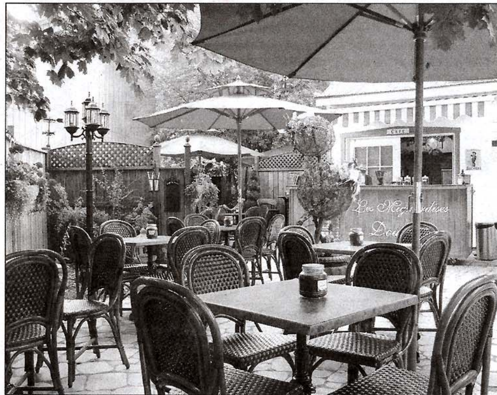
La toute nouvelle terrasse de la Fudgerie boutique des Mignardises Doucinet.

On se renseigne davantage sur la Fudgerie boutique des Mignardises Doucinet en contactant le 622-9595. (D.F.)